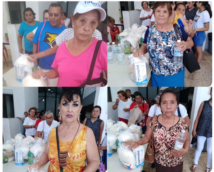
Apoyo de despensas a Agrupación de Personas de la Tercera Edad.